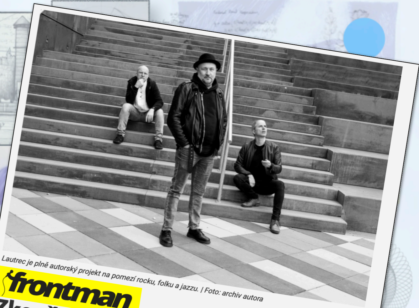
Lautrec je plně autorský projekt na pomezí rocku, folku a jazzu.